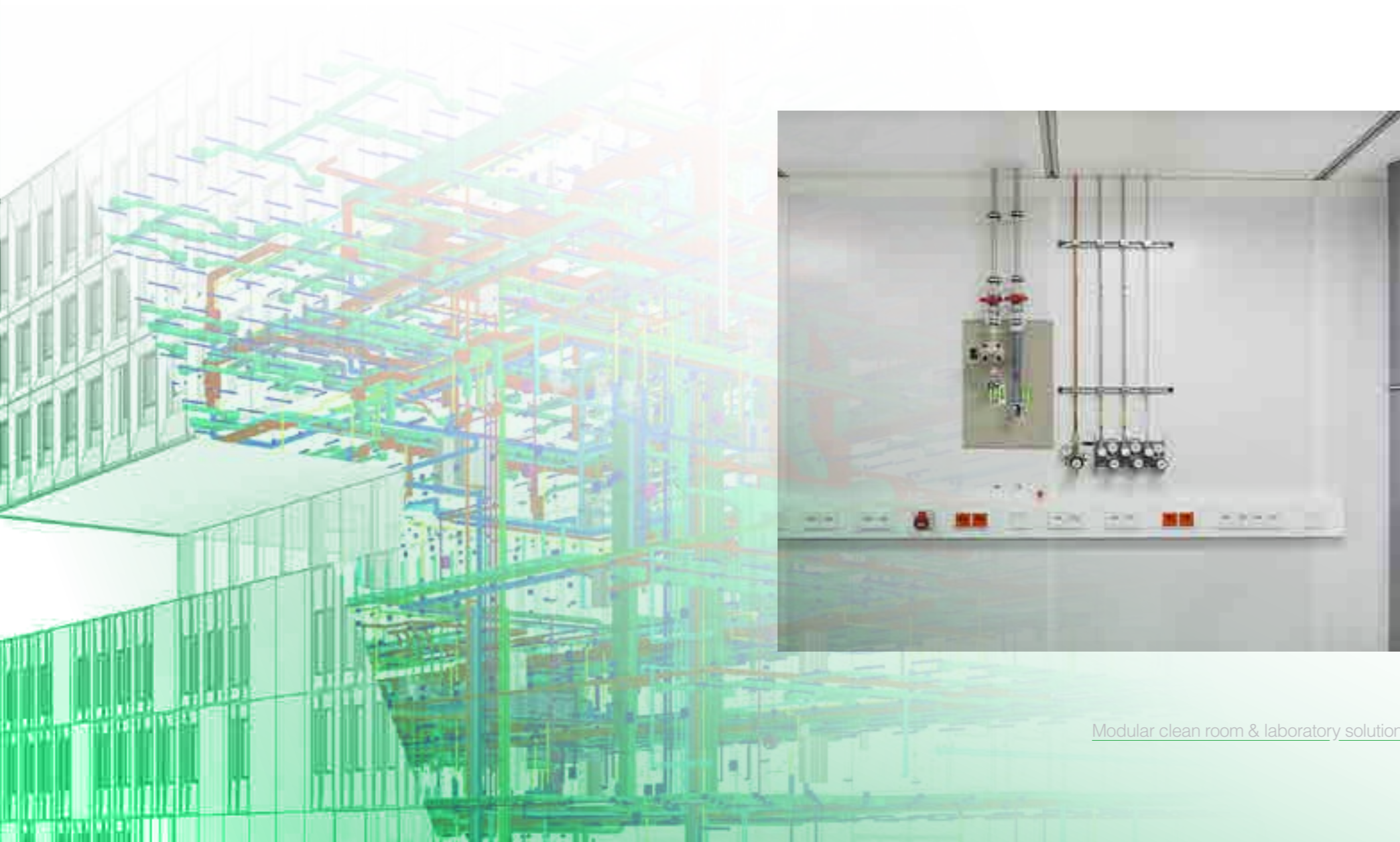
Modular clean room & laboratory solution