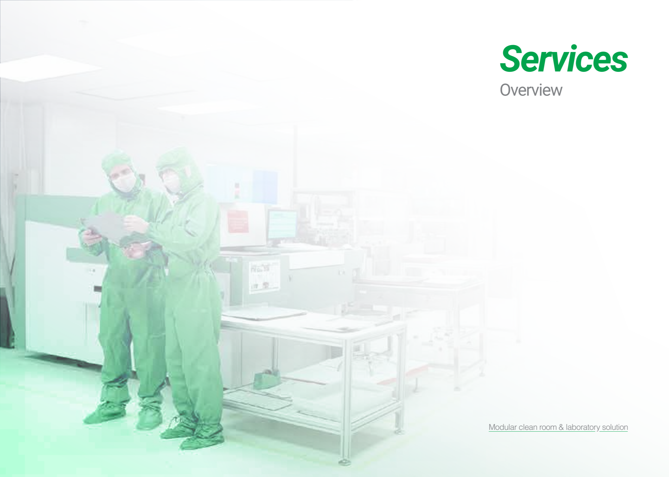
Modular clean room & laboratory solution