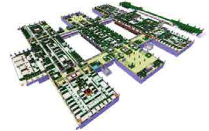
Modular clean room & laboratory solution