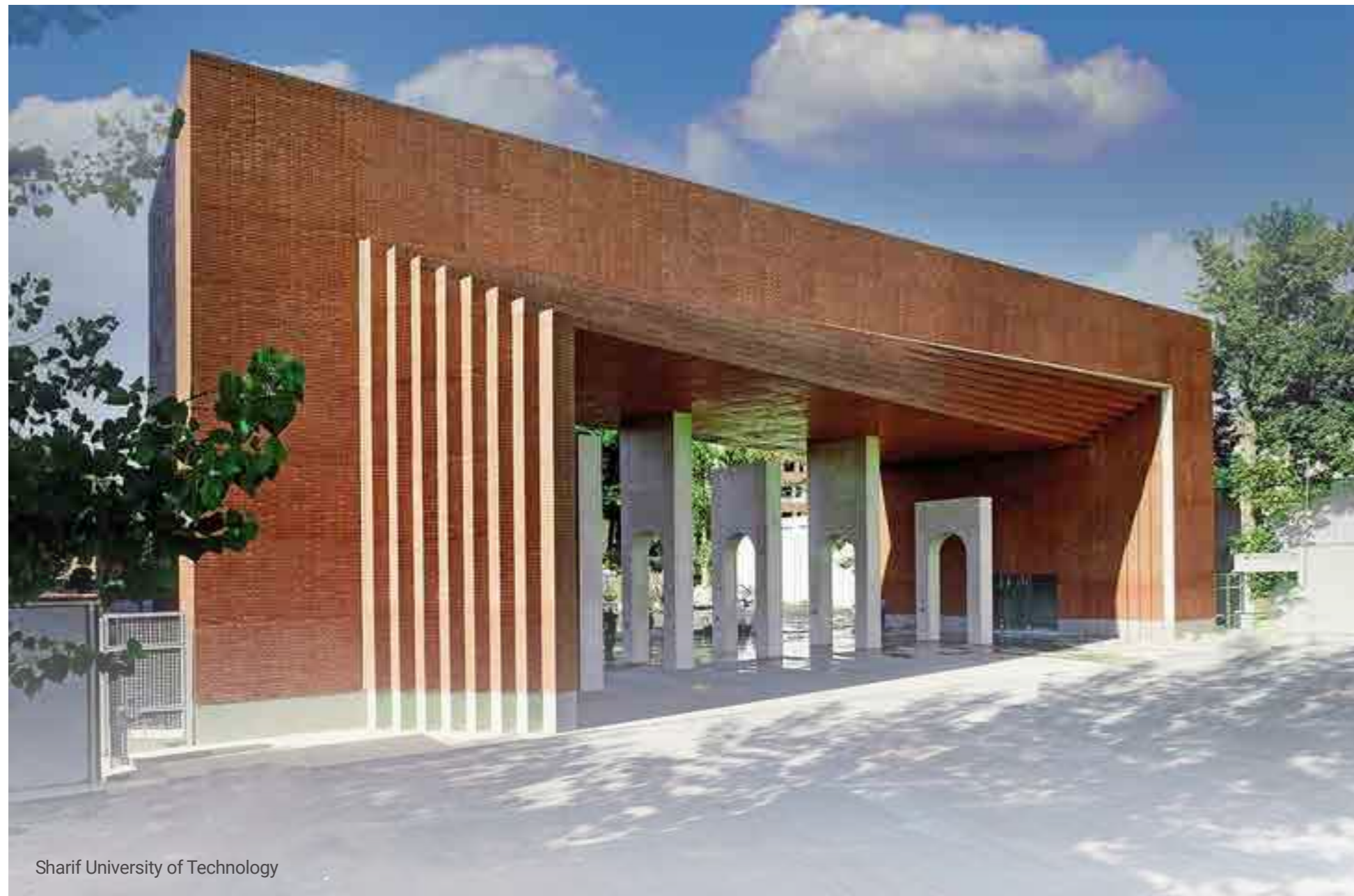
Sharif University of Technology